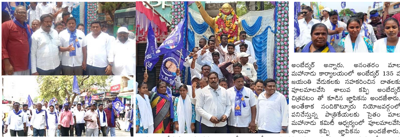
దళిత బడుగు బలహీన వర్గాల ఆశాజ్యోతి అంబేద్కర్. మాల మహానాడు ఆధ్వర్యంలో 135 వ జయంతి వేడుకలు. ర్యాలీలో భాగంగా పాల్గొన్న మాల మహానాడు నాయకులు.

500 మందికి భోజన వసతి ఏర్పాటు ఉత్తేజ ప్రతినిధి:నందికొట్లూరు, ఏప్రిల్ 14 :