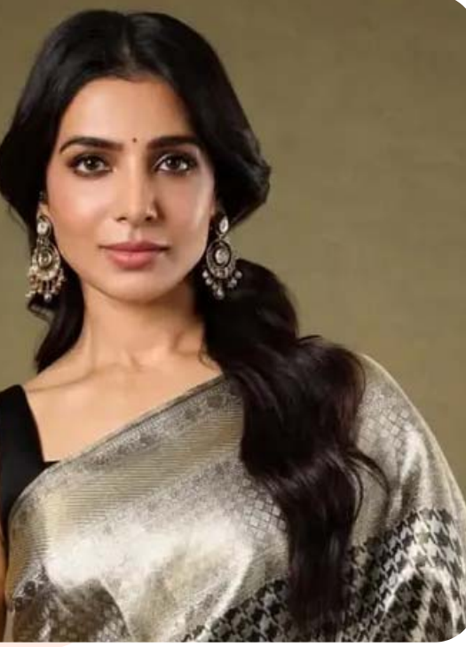
'డెకాయిట్' కు క్రవారం ప్రపంచవ్యాప్తంగా విడుదలై పాజిటివ్ టాక్ తో దూసుకుపోతుంది. ఈ నేపథ్యంలో సేమంత స్టార్ నాని ఈ చిత్రంపై ప్రశంసల వర్షం కురిపించారు. అడివి శేష్ కెరీర్ లోనే ఇది అత్యుత్తమ ప్రదర్శన అని, 'డెకాయిట్' ఒక నిజమైన బ్లాక్ బస్టర్ అని ఎక్స్ వేడికగా కొనియాడారు. 'డెకాయిట్' సినిమా ప్రీమియర్ చూసిన అనంతరం నాని తన ఎక్స్ ఖాతాలో స్పందిస్తూ, 'డెకాయిట్.. ఒక నిజమైన బ్లాక్ బస్టర్! ఈ థియేట్రీకల్ ఎక్స్ పీరియన్స్ ను అన్నలు మిన కావద్దు. అడివి శేష్ అద్భుతంగా నడించారు, తన కెరీర్ లో ఇదే బెస్ట్