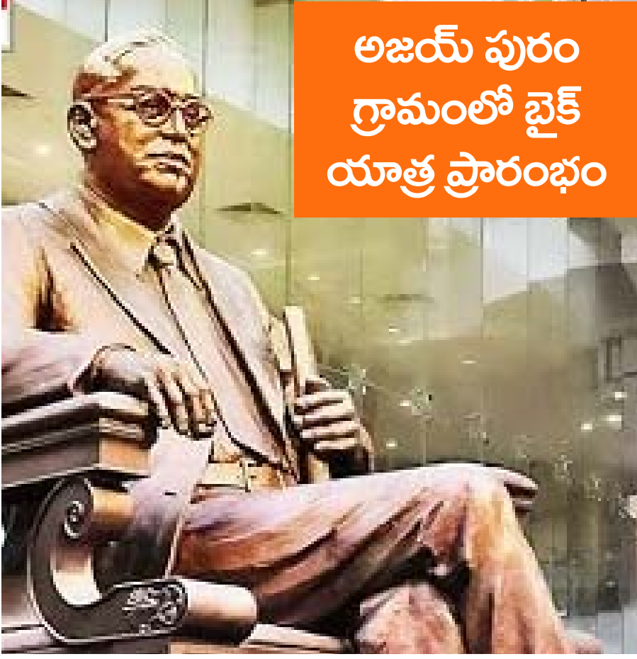
అజయ్ పురం గ్రామంలో బైక్ యాత్ర ప్రారంభం