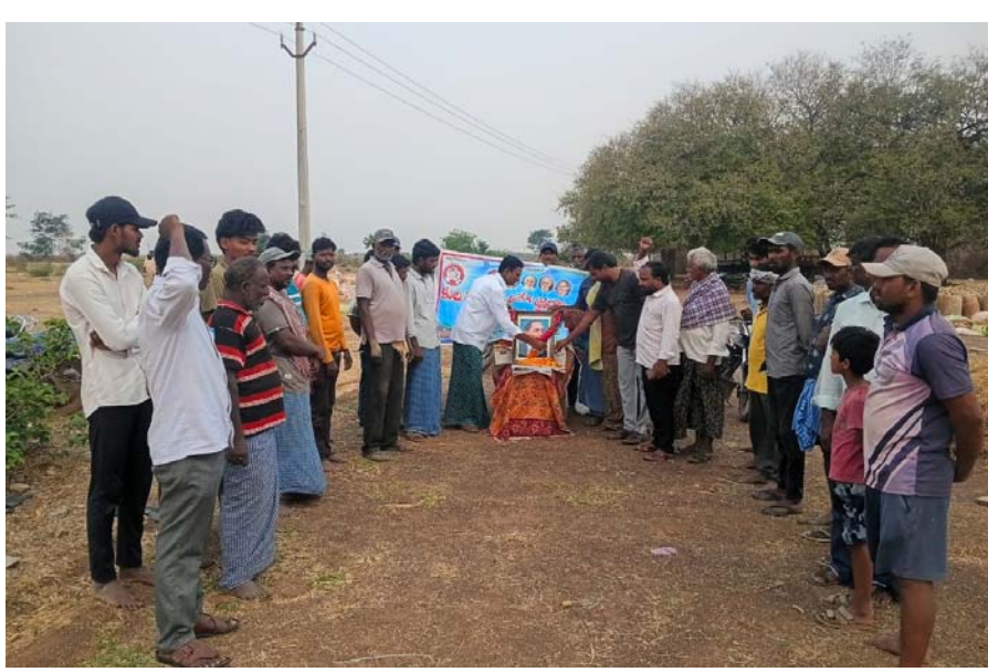
అత్యుత్తమ ఉత్తేజ ప్రతినిధి