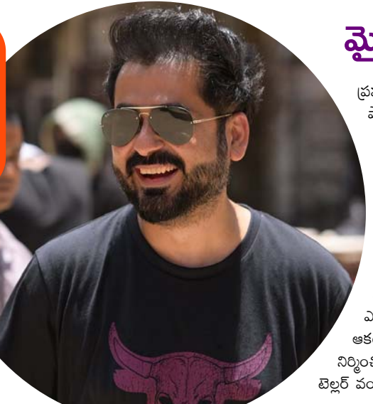
గౌరవం చూస్తుంటే, ఆయన కేవలం ఒక నటుడు మాత్రమే కాదు, ఇండియాన్ సినిమాకు ఒక ట్రాండ్ అని కామెంట్స్ చేస్తున్నారు.

ధర్ స్పందించిన తీరు ఇప్పుడు హాట్ టాపిక్ గా మారింది. సందీప్ రెడ్డి వంగా చేసిన పోస్ట్ కు రిపై ఇచ్చిన అదిత్య.. 'ది లెజెండ్ ప్రభాస్ నరకీ నా ప్రేమను తెలియజేయండి' అంటూ ట్వీట్ చేశారు. ఇక్కడ నుంచి సోషల్ మీడియాలో లెజెండ్ ప్రభాస్ ట్యాగ్స్ ఓ రేంజ్ లో ట్రెండ్ అవుతున్నాయి. ఇప్పటికే సందీప్ రెడ్డి వంగా ఆయనను 'ఇండియాన్ బిగ్గెస్ట సూపర్ స్టార్' అనే బిరుదు ఇచ్చారు. ఇప్పుడు మరో సంచలన దర్శకుడు అదిత్య ధర్ ఏకంగా 'ది లెజెండ్' అని ట్యాగ్ ఇవ్వడంతో.. రెబల్ స్టార్ ఫ్యాన్స్ సోషల్ మీడియాలో రచ్చ రచ్చ చేస్తున్నారు. అదిత్య ధర్ లాంటి దర్శకులు ప్రభాస్ పట్ల మామూలుగా ఈ