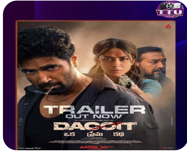
తెలుగునీరులేదు. ఓ కులాంతర ప్రేమకథకు.. తనదైన శైలిలో ట్యూటెలు, టర్నెలు జోడించి ఓ మాన యాక్షన్ సినిమాని అవిష్కరించే ప్రయత్నం చేశారు శేష్. హీరో ఎప్పుడైతే జైలు నుంచి తప్పించుకుంటాడో అక్కడి నుంచి సినిమా వేగం వుండుతుంది.