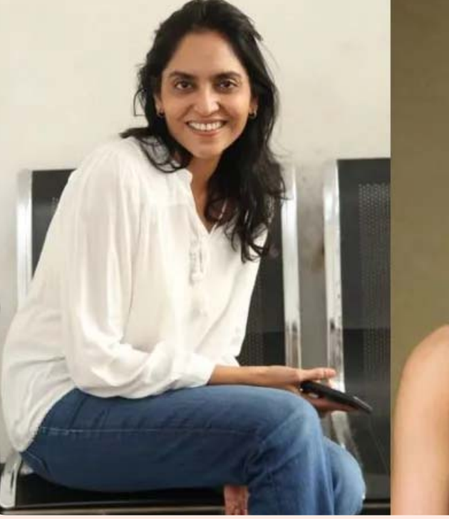
నటుడు నాని ప్రత్యేక అభినందనలు అడివి శేష్, మృణాల్ రాకార్ ప్రధాన పాత్రల్లో నడించిన రొమాంటిక్ క్రైమ్ థ్రిల్లర్