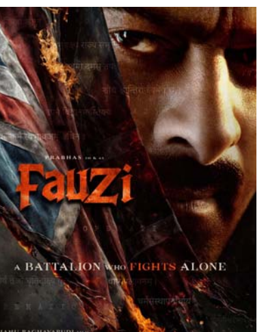
నిర్మాణ పనులను ముమ్మరం చేస్తూ ఏకకాలంలో షూటింగ్ ను పూర్తి చేసేలా ప్రణాళికలు సిద్ధం చేసింది.

ఈ ఏడాది ఆరంభంలో రాజాసాహెబ్ ఫౌజీ ఇచ్చిన రెబల్ స్టార్ ప్రభాస్.. ఇదే ఏడాదిలో సాల్విట్ హిట్ ఇవ్వాలని డిస్టెండ్ అయ్యాడు. ప్రభాస్ నుంచి 'ఫౌజీ' సినిమా ప్రేక్షకుల ముందుకు రాబోతోంది. సీతారామం తంజావూరు దర్శకుడు హను రాఘవపూడి తెరకెక్కిస్తున్న ఈ సినిమా సెకండ్ వరల్డ్ వార్ బ్యాక్ డ్రాబ్ లో రూపొందుతోంది. ఇప్పటికే మేజర్ పార్ట్ షూటింగ్ కంప్లీట్ చేసుకుంది. అఫీషియల్ గా ప్రకటించనప్పటికీ.. వచ్చే దసరాకు ఫౌజీని విడుదల చేయడానికి సన్నాహాలు చేస్తున్నారని మేకర్స్ కానీ ఈ ఏడాది డిసెంబరు పోస్ట్ పోస్ట్ అయ్యే ఛాన్స్ ఉందనే టాక్ వినిపిస్తోంది. అయితే చిత్ర యూనిట్ మాత్రం ఈ సినిమాను ముందుగా అనుకున్న సమయానికే ప్రేక్షకులకు అందించాలని పట్టుదలతో ఉంది. ఇందుకోసం నిర్మాణ పనులను ముమ్మరం చేస్తూ ఏకకాలంలో షూటింగ్ ను పూర్తి చేసేలా ప్రణాళికలు సిద్ధం చేసింది. షెడ్యూల్ ప్రకారం సినిమాను పూర్తి చేయడం కోసం మేకర్స్ 'సెకండ్ యూనిట్' ను కూడా రంగంలోకి దింపినట్లుగా తెలుస్తోంది. ప్రస్తుతం ఒక వైపు ప్రధాన తారాగణంపై దర్శకుడు హను రాఘవపూడి అత్యంత కీలకమైన సన్నివేశాలను చిత్రీకరిస్తుండగా, మరోవైపు ఈ సెకండ్ యూనిట్ సినిమాలోని యాక్షన్ ఎపిసోడ్స్ ను షూట్ చేస్తోందట. ఇలా రెండు యూనిట్లతో పని చేయడం వల్ల సమయం ఆదా అవుడమే కాకుండా, క్వాలిటీ విషయంలో కూడా ఎక్కడా రాజీ పడకుండా అవుట్ ఫుల్ వస్తుందని డిమ్ భావిస్తోంది. కాబట్టి.. దసరాకు ఫౌజీ రిలీజ్ డేట్ ఫిక్స్ అయినట్టే, కాకపోతే.